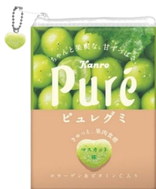
ピュレグミ マスカット