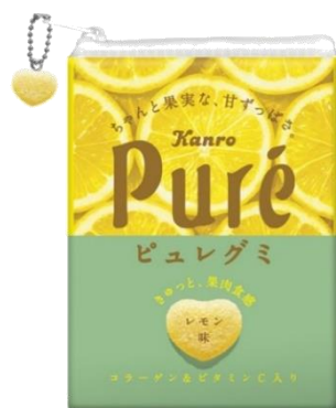
ピュレグミ レモン