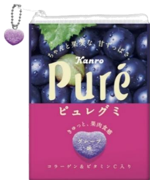
ピュレグミ グレープ