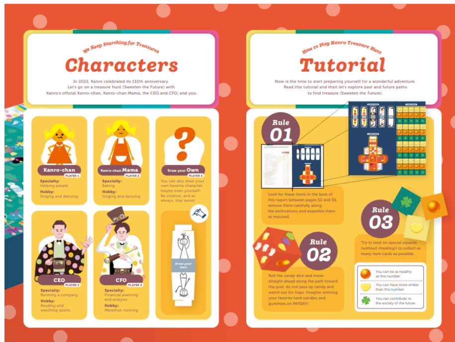
中面：ボードゲームとしても遊べるように工夫