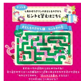
うさリンのおとしものさがし