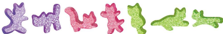
目にも楽しい7(ニヤニヤ)種類のネコ型グミ

カンデミーナシリーズ特有の独特な形状から生まれる“ニヤみつきハード”な弾力食感とパンチ力がクセになること間違いなし!? 日常のおやつや小腹満たしに、パッケージにちりばめられたネコにまつわる小ネタとともに楽しみください。