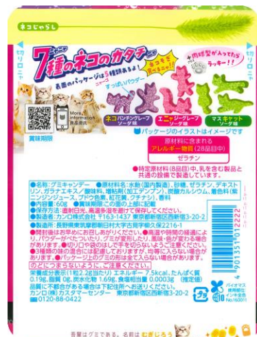
パッケージ裏面にもネコに関する小ネタが満載