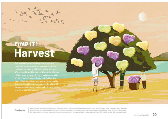
イラストと当社の商品（ピュレグミ）を融合させた扉ページ一例